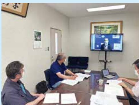
日本土地家屋調査士会連合会定時総会（ライブ配信）