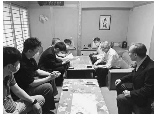
松陰神社との協議