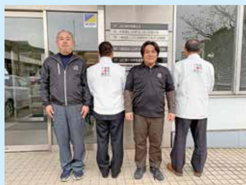
土地家屋調査士ウェア 助成実施中