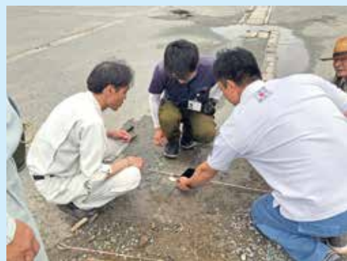
登記創造プロジェクト（重心点設置作業）