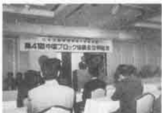
連合会長 あいさつ