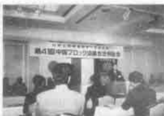
地元会長 開会あいさつ