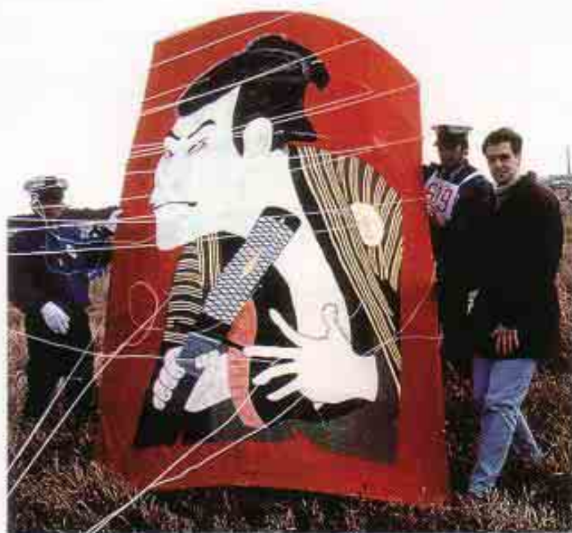
山口県土地家屋調査士会