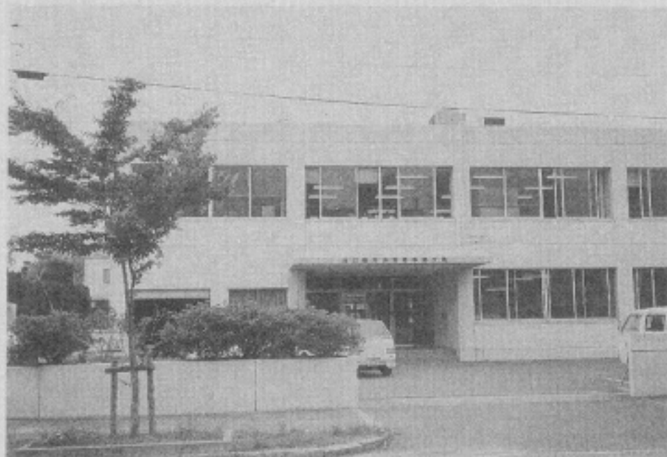
(山口地方法務局 宇部支局)